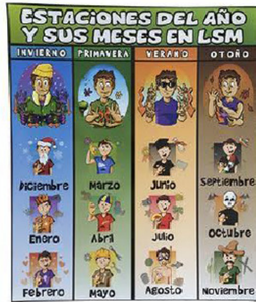
Cartel estaciones y meses 58 x 50 cm.