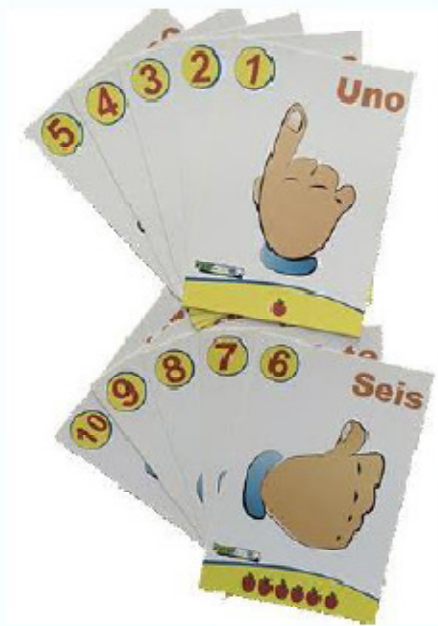
Tarjetas con números 1 al 10 905 x 14 cm