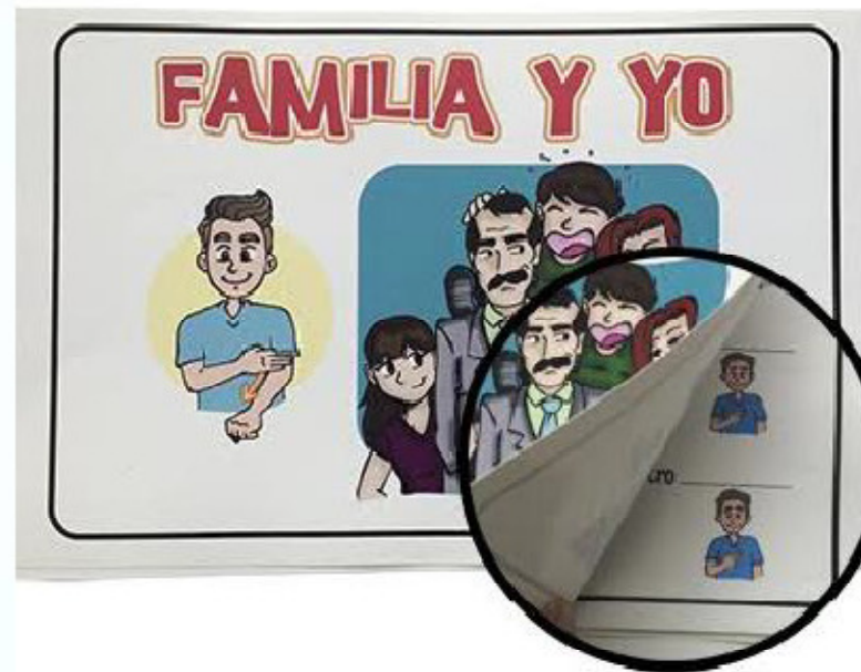
Libro mi familia y yo 43x28 cm