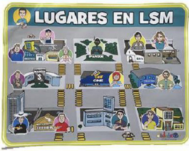
Cartel lugares 54.7 x 41.5 cm