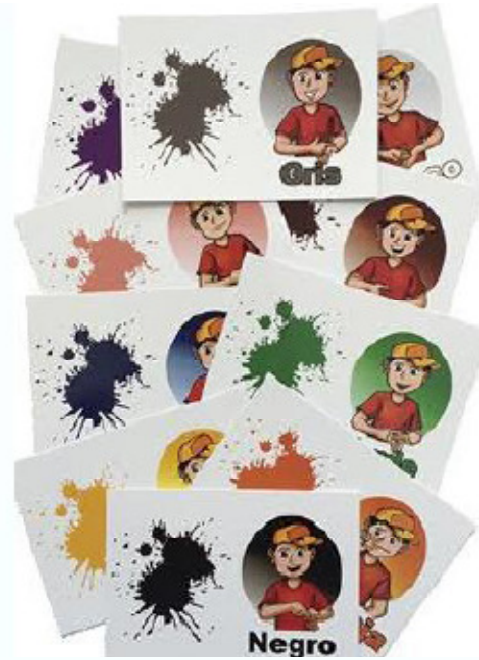
11 PZAS TARJETAS DE COLORES 13.5 X9.5 CM