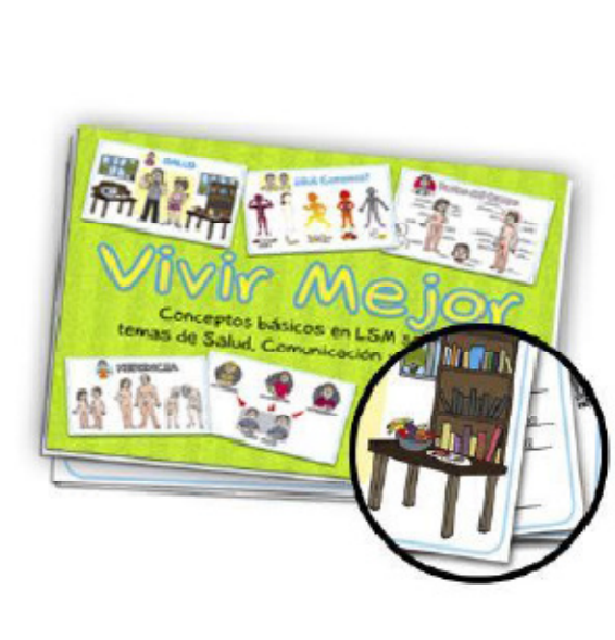
Vivir mejor, salud y cuerpo humano 43 x 28 cm