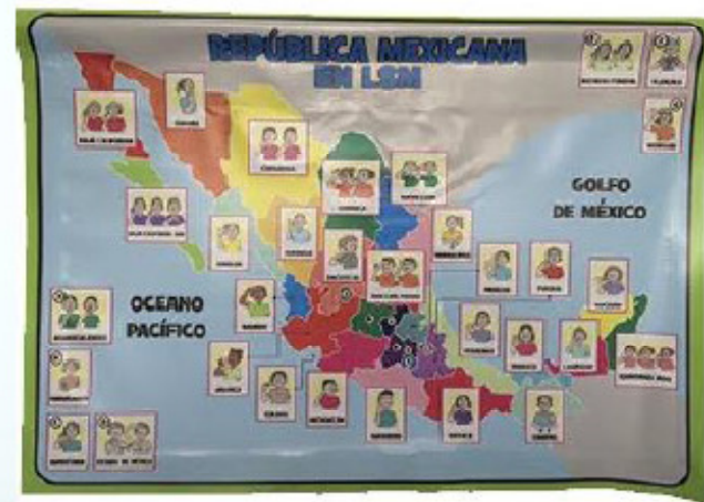
Lona de la republica mexicana 72 x 52 cm