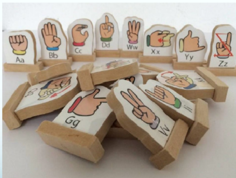
ABC piezas separadas.