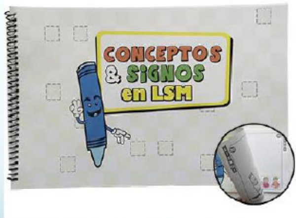
Libro para colorear conceptos y signos 68 pág.. 43 x 28 cm