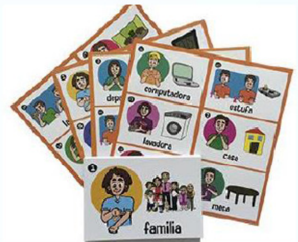
Lotería artículos de casa