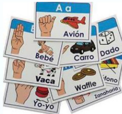
28 TARJETAS CONCEPTO, SEÑAS Y OBJETO 13.5 X 9.5 CM