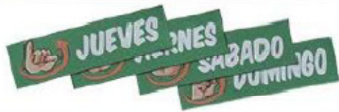
Ubicación con el tiempo magnético