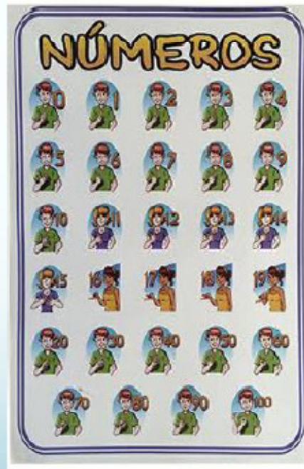
Cartel de números 43x28 cm