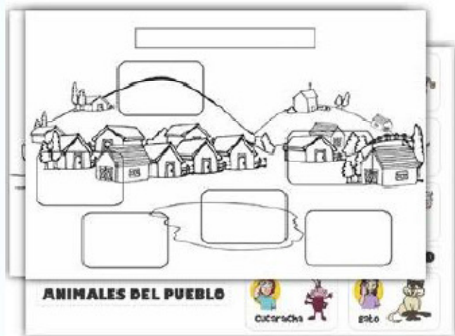
Libro para recortar animales y su ecosistema.