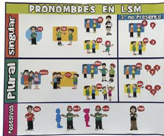
Cartel pronombres personales, posesivo 50 x 41 cm