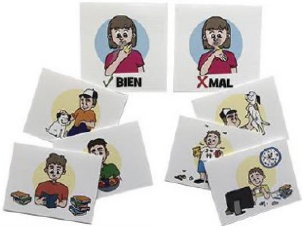
Concepto bien y mal 14 x 11 cm