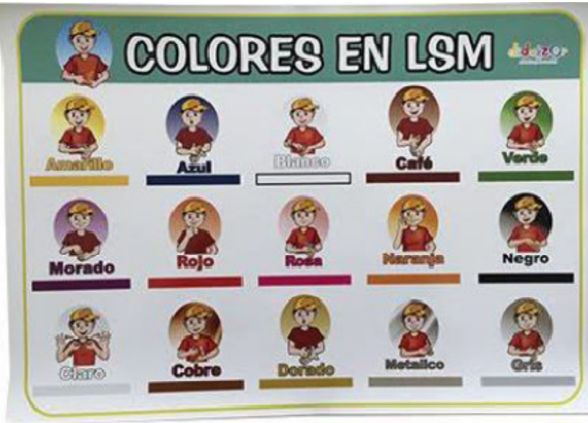
Cartel colores 52 x 36 cm