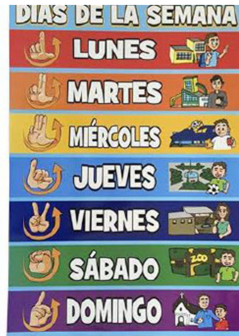
Cartel días de la semana 45 x 65 cms