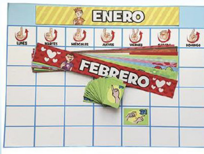
Calendario anual magnético 62 x 40 cms