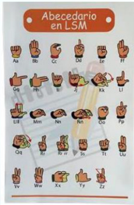
LAMINA ABECUARIO 42X 27 CM.