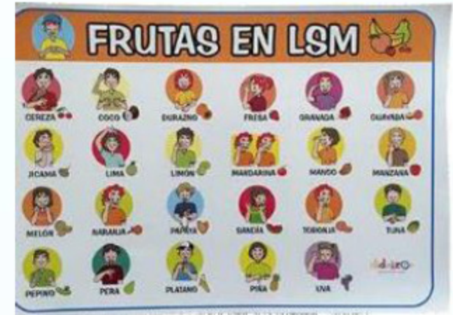
Cartel de frutas 52x36 cm