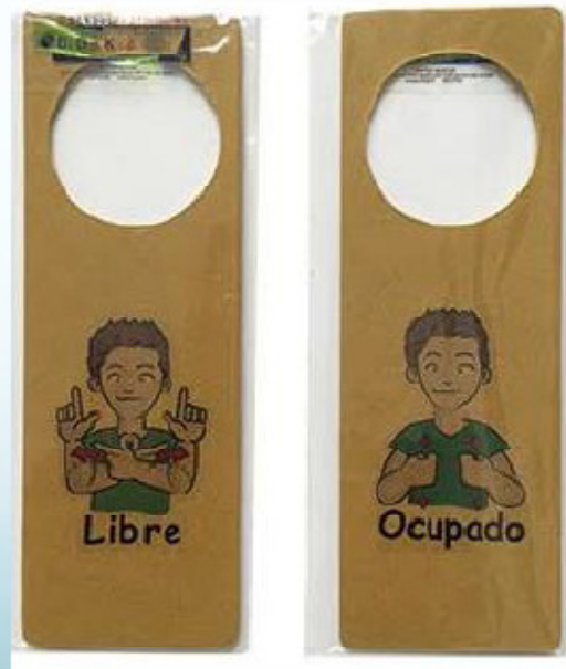
PICAPORTE LIBRE-OCUPADO 24 X 8 CM