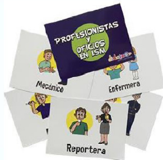
Tarjetas profesiones y oficios 14x 10 cm