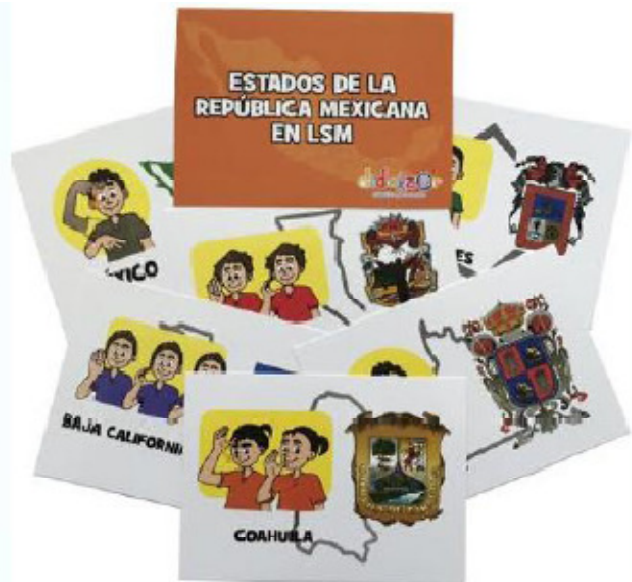
Tarjetas estados de la republica 14 x 10 cm