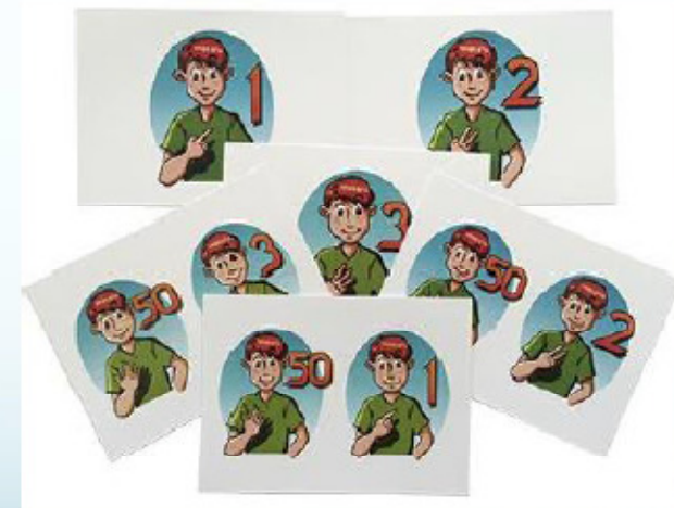
Tarjetas rígidas números 1 al 100 14 x 10 cm