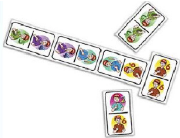
Domino de números