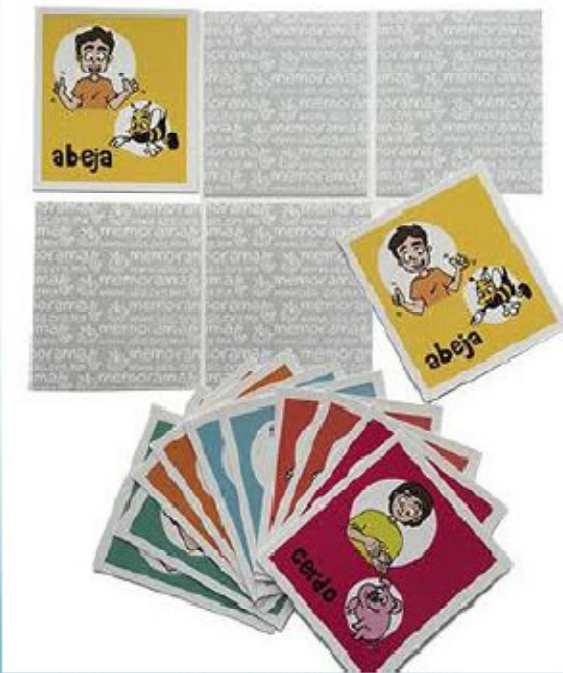
MEMORIA DE ANIMALES 20 PZAS.